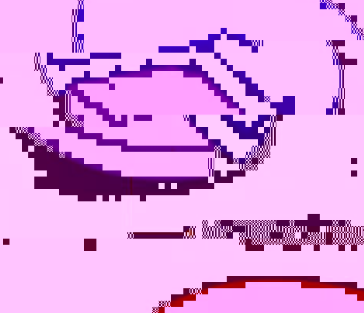
全球20号胶消费量 (单位: 10,000 吨)